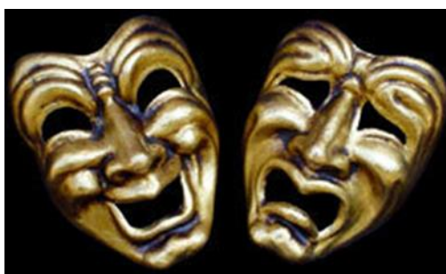
La comedia dell Arte: CM2-CE2