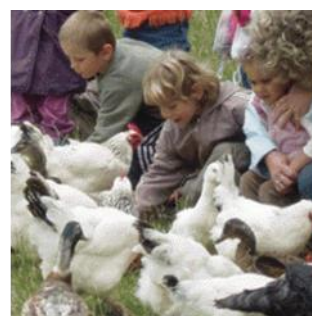
Sortie à la ferme PS/MS