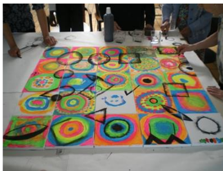
Ateliers cour carrée CE2 M Chastang