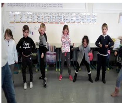
Projet Théâtre CP/ CE1/PS Les émotions