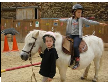
Poney: GS En cours